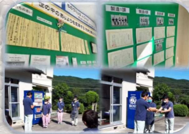
↑ ↑ 年1回の活動実績の表彰を行っている様子